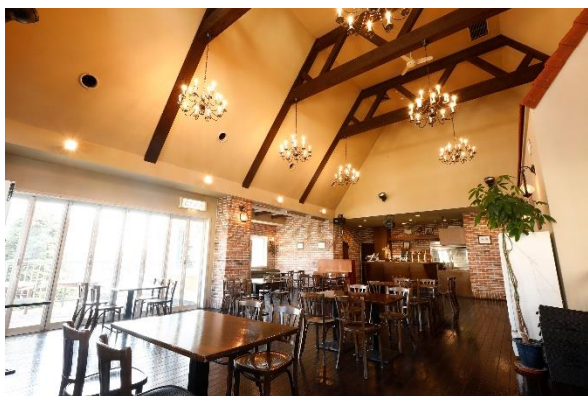
レストラン(2F) フロアイメージ