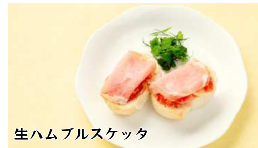
生ハムブルスケッタ