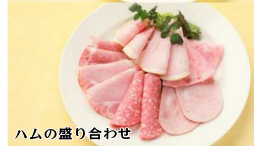
ハムの盛り合わせ