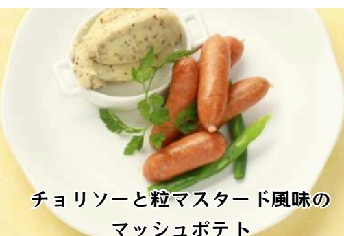
チョリソーと粒マスタード風味の マッシュポテト