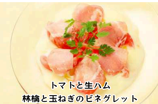
トマトと生ハム 林檎と玉ねぎのビネグレット