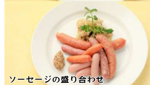
ソーセージの盛り合わせ