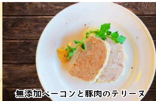
無添加ベーコンと豚肉のテリーヌ