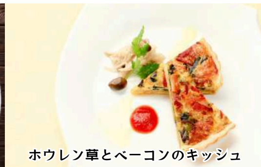
ホウレン草とベーコンのキッシュ