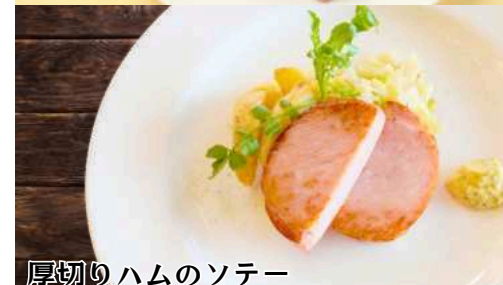
厚切りハムのソテー