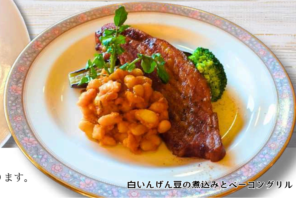
白いんげん豆の煮込みとベーコングリル