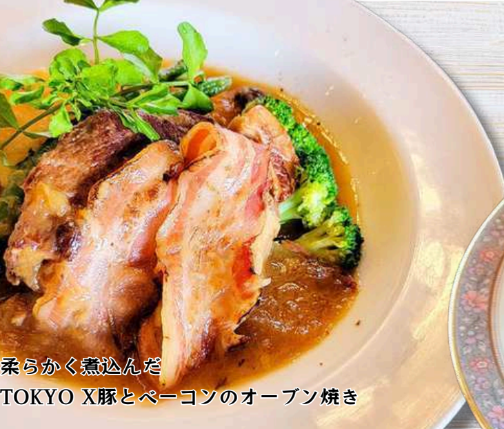
柔らかく煮込んだ